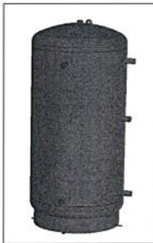
AQ PT... ErP

A nyilatkozat tárgya / object of the declaration / Gegenstand der Erklärung / Objet de la déclaration / Предмет декларации / Předmět prohlášení / Obiectul declarației: