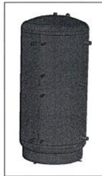
AQ PT...C2 ErP